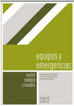
Folleto “EQUIPOS Y EMERGENCIAS” (A4)