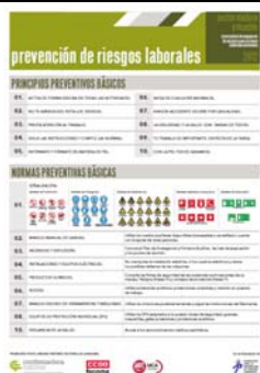
Cartel “PREVENCIÓN DE RIESGOS LABORALES. Principios y Normas preventivas básicas” (35 x 50 cm)

Adjuntamos documentación elaborada en el último período.