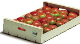
Envase de 600 x 400 mm UNE 49056

Huella de Carbono: -0.671 kg de CO 2 e*/unidad