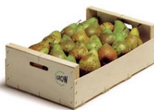
Envase de 500 x 300 mm UNE 49055

Huella de Carbono: -0.758 kg de CO 2 e*/unidad