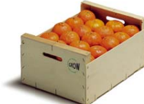
Envase de 400 x 300 mm UNE 49054

Huella de Carbono: -0.286 kg de CO 2 e*/unidad