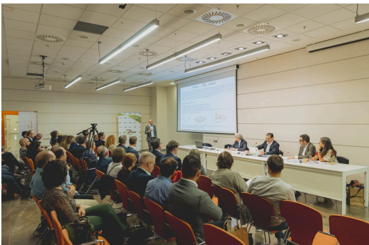
Sala Ausiàs March, Feria de Muestras Valencia